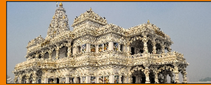
Banke Bihari Temple