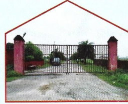
सरस्वती मेट्रो सिटी