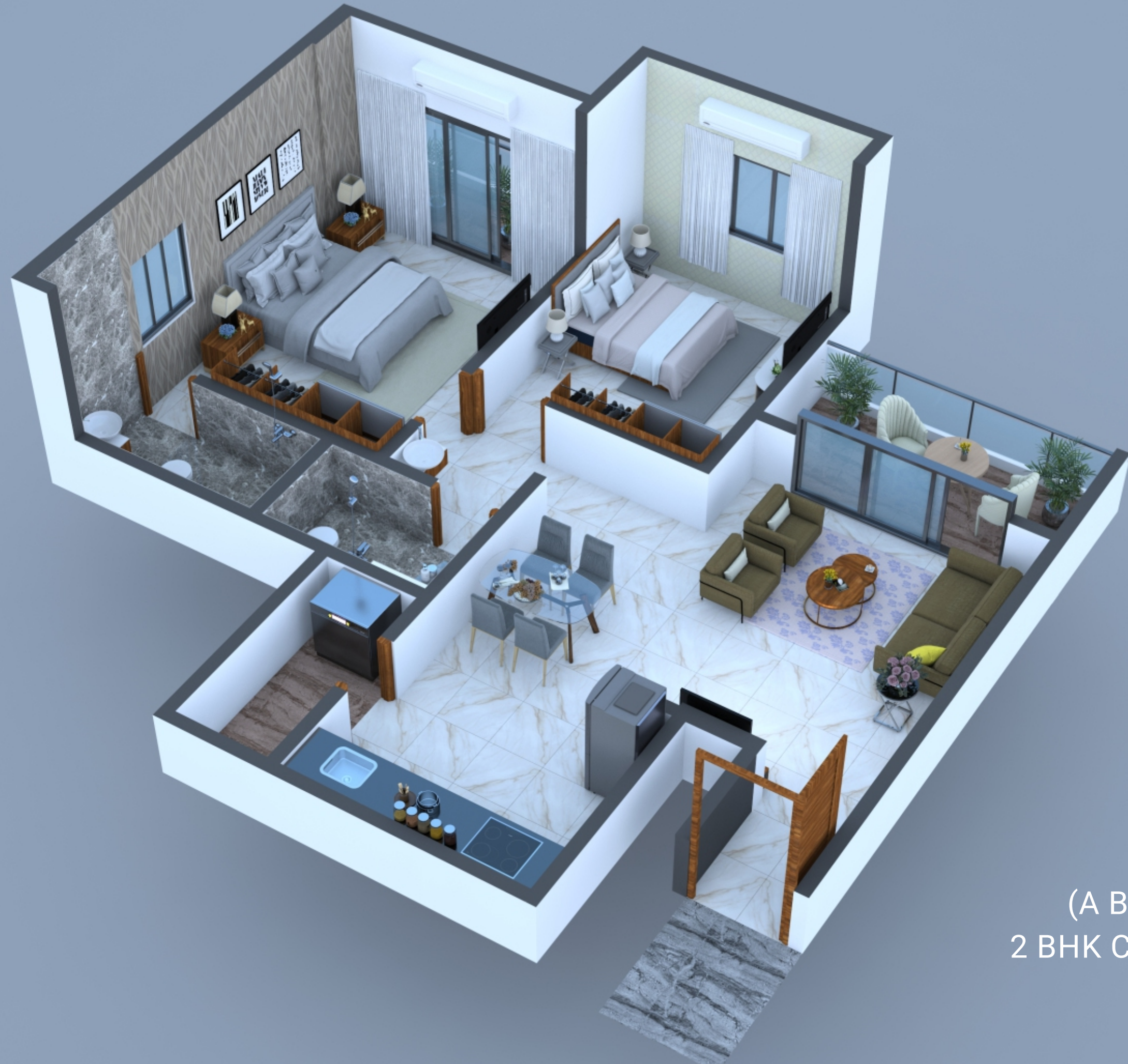
(A BUILDING) 2 BHK CUT SECTION