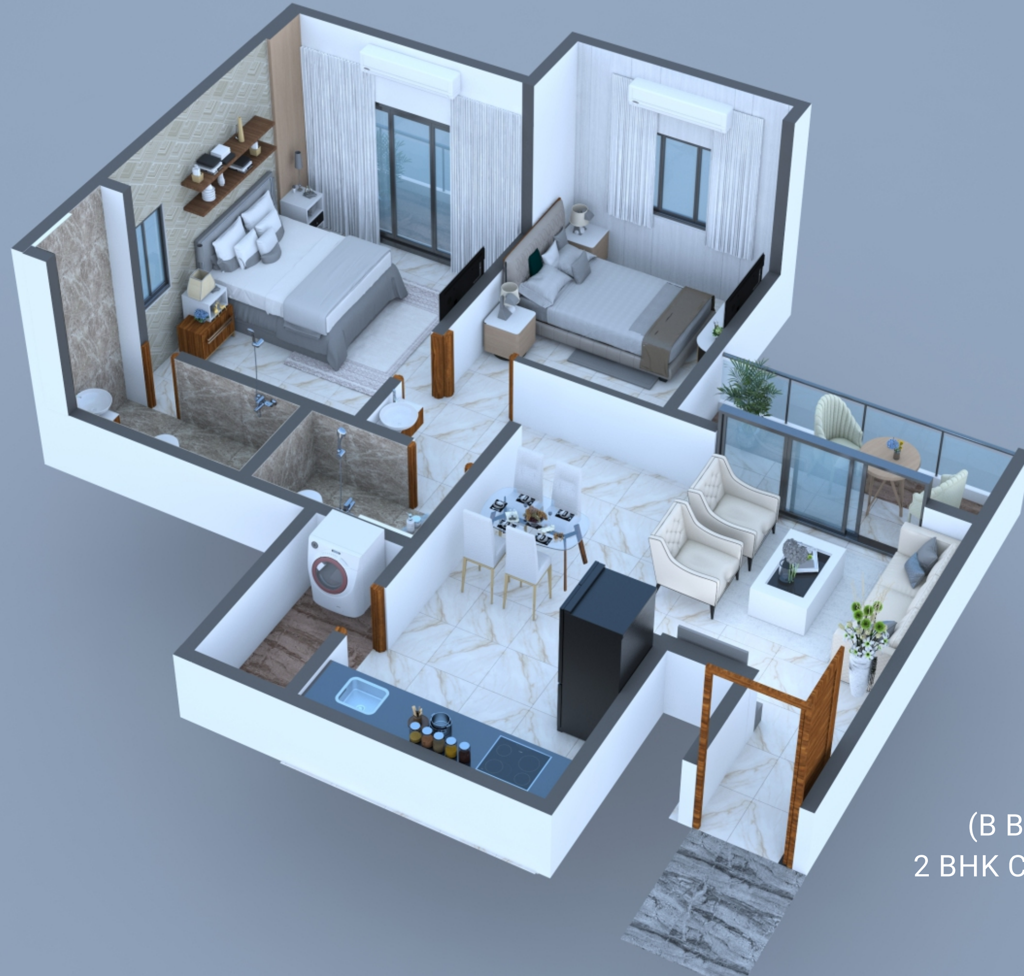
(B BUILDING) 2 BHK CUT SECTION