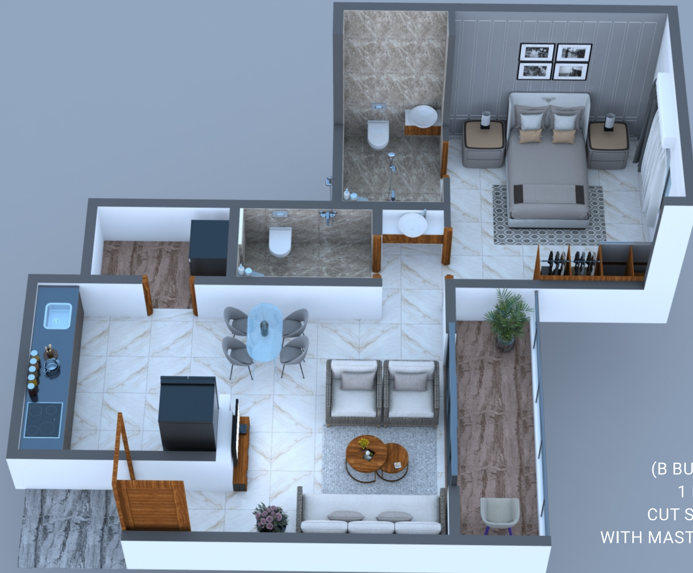
(B BUILDING) 1 BHK CUT SECTION WITH MASTER BEDROOM