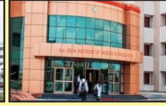
AIIMS (16 KM)