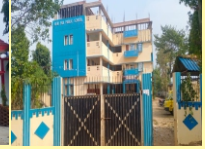
New Era Public School (0 KM)