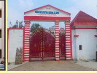
New Patliputra Central School (0 KM)