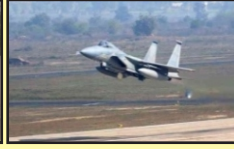
Bihta Airforce Base (10 KM)