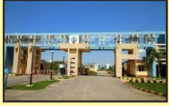
IIT Patna (5 KM)