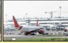
Bihta Intl. Airport (10 KM)