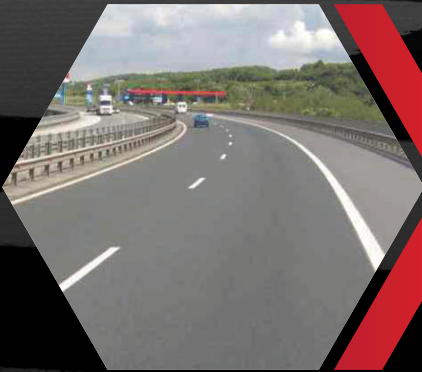
Eastern Peripheral Expressway