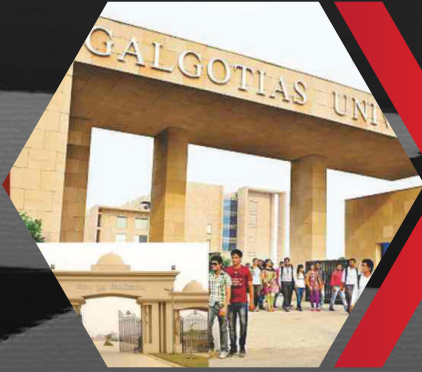
Indian leading Institute at Walking Distance