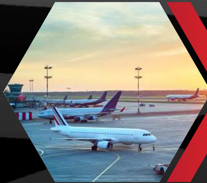
Noida International Airport