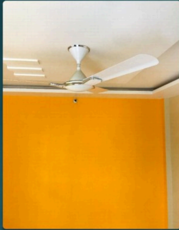
Forsling In All Room