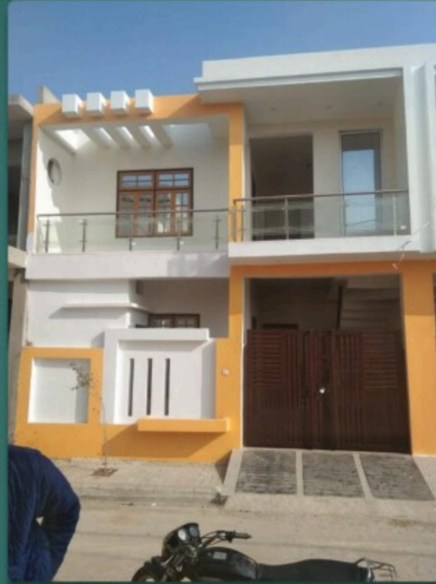
Ready to Move