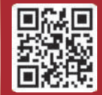
Scan to own

info@jsrgroupsuncity.com | www.jsrgroupsuncity.com | /jsrgroupsuncity