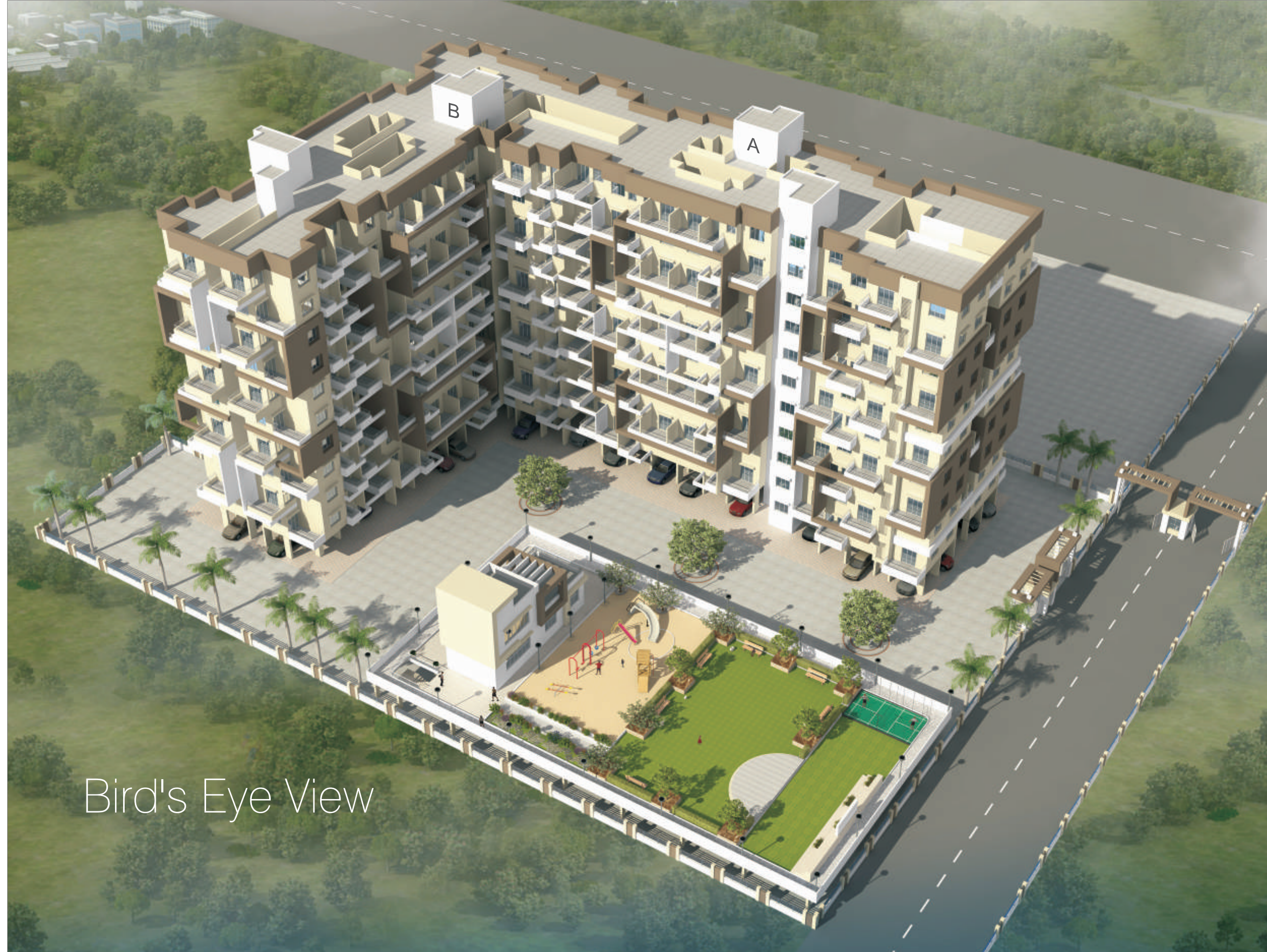
Bird's Eye View