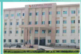
K.D. MEDICAL INSTITUTE/HOSPITAL