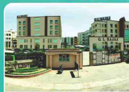
G.L. BAJAJ INSTITUTE